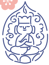
重要文化財 大日如来坐像