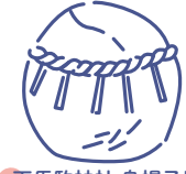
天馬駒神社 烏帽子岩