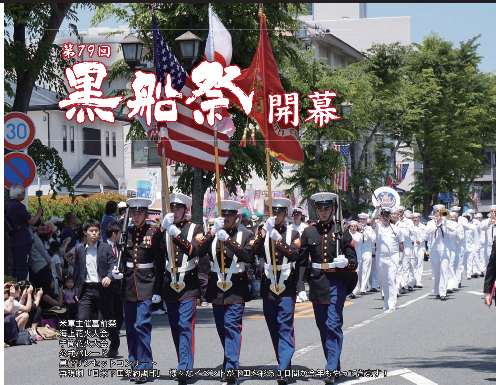
米軍主催墓前祭 海上花火大会 手筒花火大会 公式パレード 黒船サンセットコンサート 再現劇「日米下田条約調印」 様々なイベントが下田を彩る3日間が今年もやってきます!