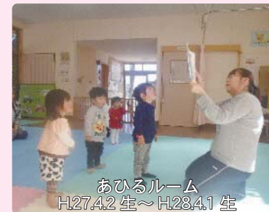
あひるルーム H27.4.2 生～H28.4.1 生