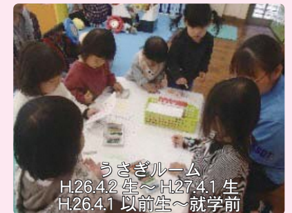
うさぎルーム H26.4.2 生～H27.4.1 生 H26.4.1 以前生～就学前

伊豆市にて「天城北道路」のうち、「湯ヶ島第三トンネル(仮称)」の貫通式が行われ、参加してきました。伊豆地区の観光振興と渋滞緩和、防災面等から伊豆縦貫自動車道全線の早期完成に向けて、今後も要望活動等に邁進していきます。