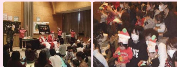
ミニミニクリスマス会

暦の上では、立春を迎え春の訪れを待っていた植物もあちらこちらで芽を出し始めました。支援センターのお友達と植えた「チューリップの芽」も少しずつ顔を出しています。