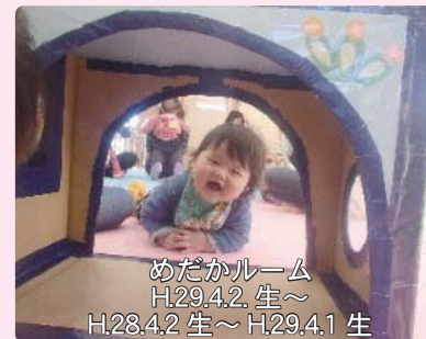
めだかルーム H29.4.2 生～ H28.4.2 生～H29.4.1 生