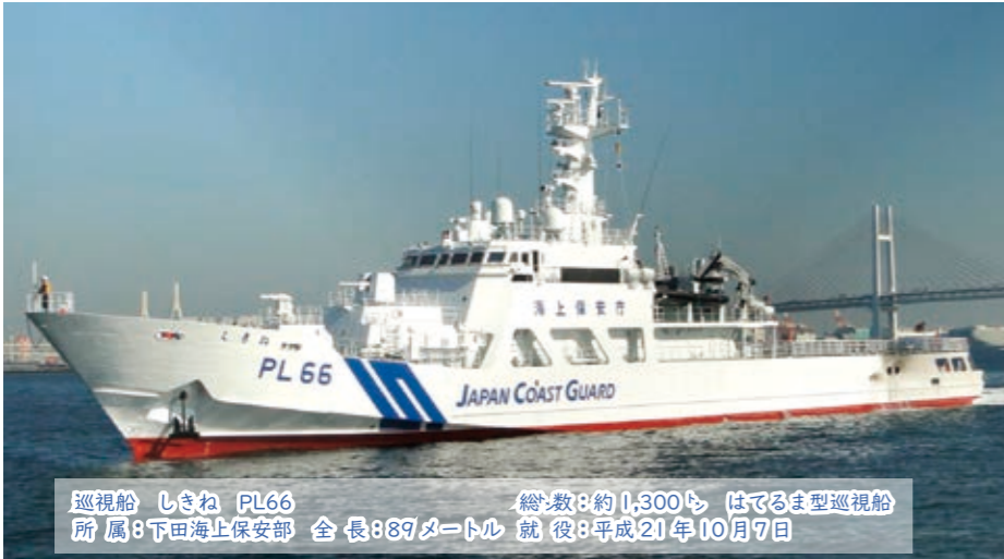
巡視船 しきね PL66 総数：約1,300隻 はでるま型巡視船 所属：下田海上保安部 全長：89メートル 就役：平成21年10月7日