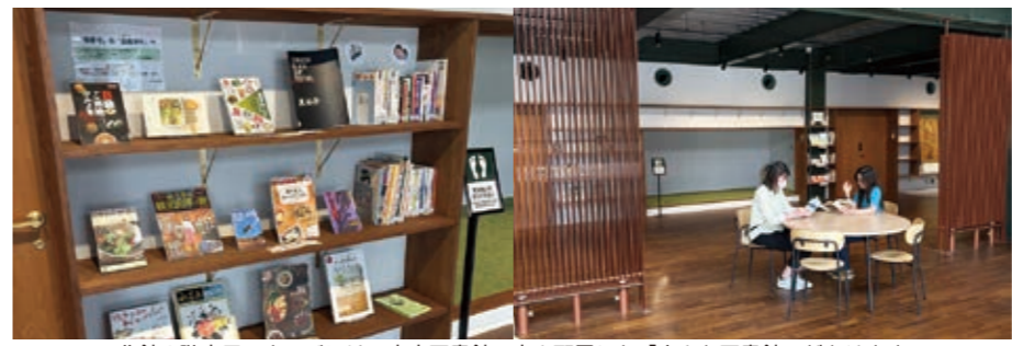
北館1階市民ラウンジには、市立図書館の本を配置した「小さな図書館」があります。待ち合わせや休憩の合間に、本に触れてみてはいかがでしょうか。

—体験会—※雨天決行。荒天及び体験者がいない場合は、中止。 ○日時 ・7月25日(土) 10時~12時、13時~15時 ※申込期限:7月24日(金) ・7月29日(水) 10時~12時、13時~15時 ※申込期限:7月28日(火) ・8月19日(水) 10時~12時、13時~15時 ※申込期限:8月18日(火) ・8月22日(土) 10時~12時 13時~15時 ※申込期限:8月21日(金) ○内容 海水浴にサポートが必要な方に3名のサポーターがつき、海水浴を楽しみます。 ○参加費:無料 ○募集:体験者(各回3名まで) サポーター(各回9名程度) —水陸両用車イスを外浦海水浴場にて貸し出します!— 貸出し期間:令和8年7月18日~令和8年8月23日 詳しくは上記問合せ先まで。