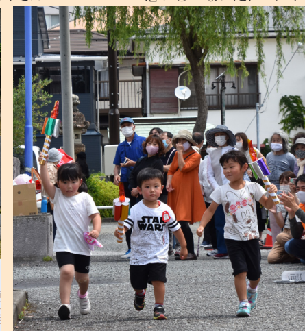
手作りトーチを手に園児による模擬聖火リレー