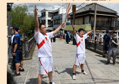
思いをつないだトーチキス