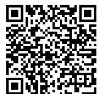
登録用 QR コード

登録者数は、1年前より800人以上増加しています。まだ、登録していない方はぜひ、登録をお願いします。