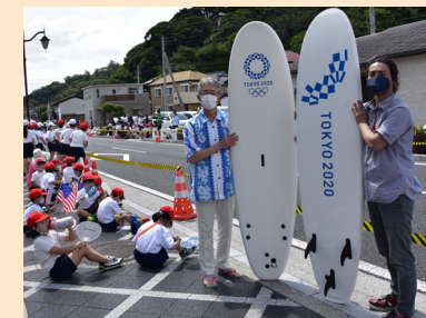
サーフィンホストタウンを盛り上げ