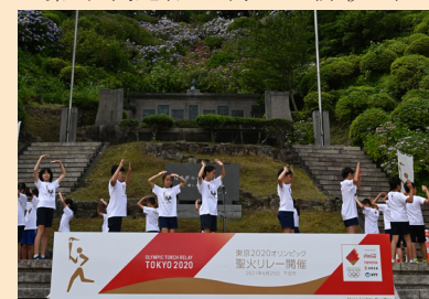
サポートランナーによる東京五輪音頭