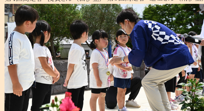
模擬聖火リレーを終え市長から金メダルの贈呈