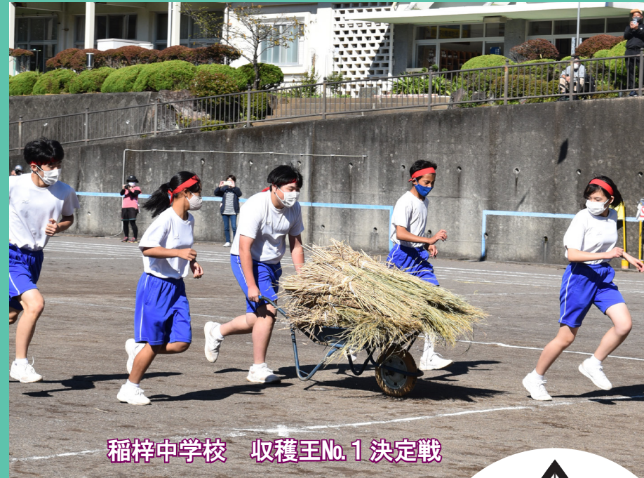
稲梓中学校 収穫王No.1 決定戦