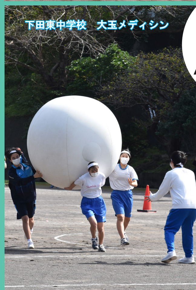
下田東中学校 大玉メデysin