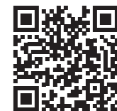
NHK 静岡放送局 ホームページ QR

WEBの場合 NHK サイトの専用申し込みフォームからお申し込みください。 https://www.nhk.or.jp/shizuoka/