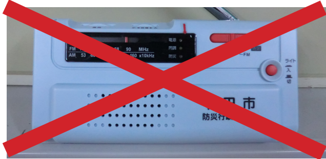
防災ラジオ（令和4年11月末まで）