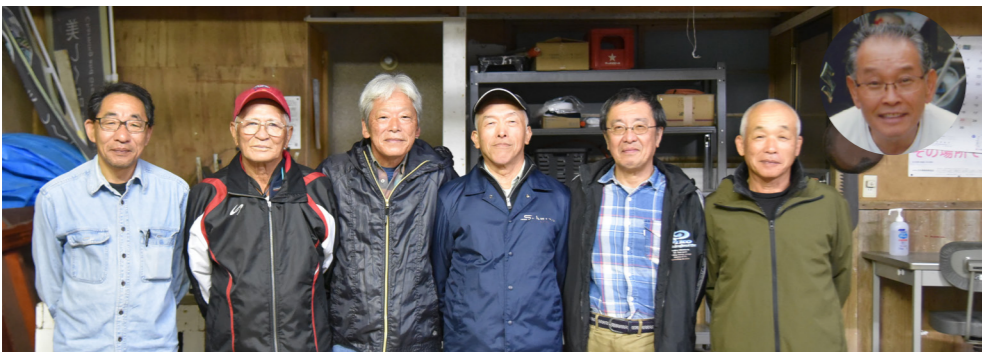
大沢 WANA 会 (大沢)

多年にわたり、大沢地区内の有害鳥獣捕獲活動による、農産物などの被害軽減に貢献されました。