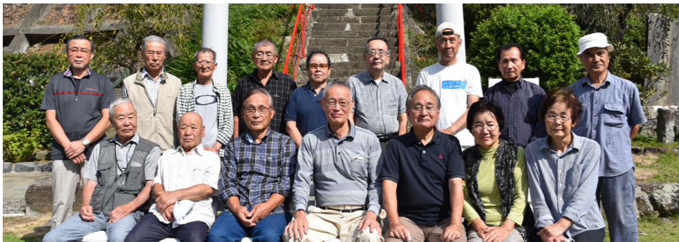
優良団体 蓮台寺花の会 (蓮台寺)

平成19年から現在までの14年の永きにわたり、蓮台寺地区内の花壇や植栽の管理・手入れをボランティアにて行うなど、地域資源の管理・活用に貢献されました。