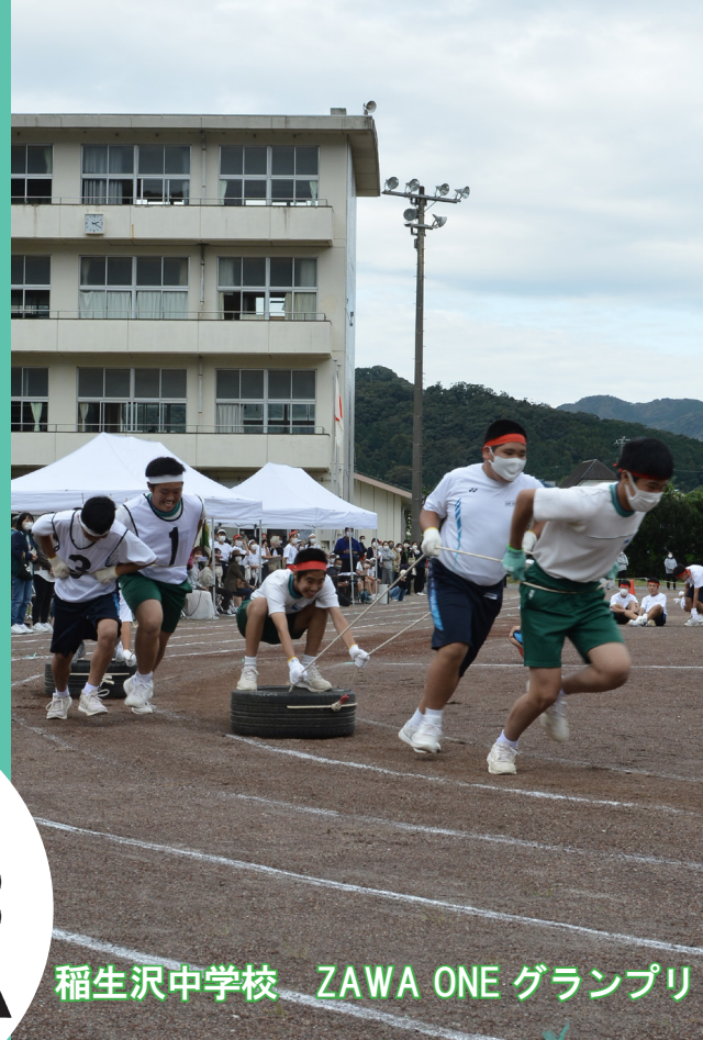
稲生沢中学校 ZAWA ONE グランプリ