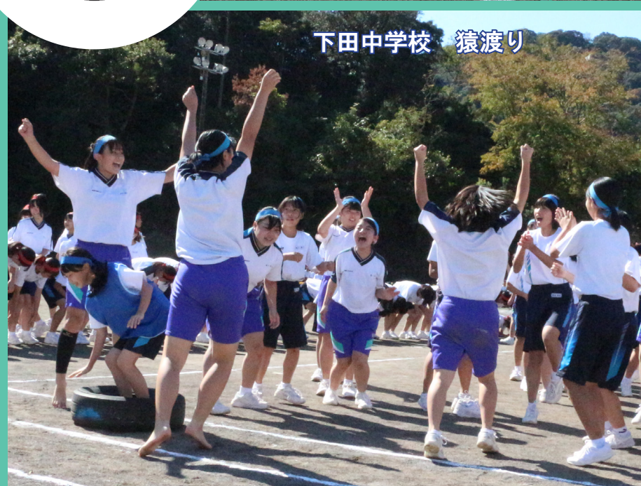
下田中学校 猿渡り