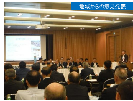
伊豆縦貫自動車道建設促進期成同盟会 会長 静岡県知事 川勝 平太

伊豆縦貫自動車道等の全線開通に向け、大会の出席者が天城北道路、河津下田道路及び東駿河湾環状道路の整備促進や、天城峠を越える区間の早期事業化等を強く求めていくことを決議しました。