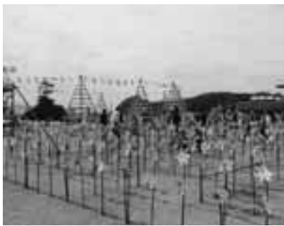
花の風ぐるまの迷路

会場に展示された風ぐるまを「花の風ぐるまの本数世界一」にしようとギネスブックに申請中です。みんなで作った風ぐるまが世界に羽ばたけるよう期待しましょう!