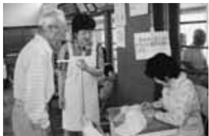
健康部門 健康診断をサポート