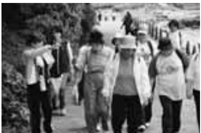
地域部門 歩こう会での活動の様子

2つある活動部門の中で、活動したいと思われる部門に登録してください。(活動期間・年齢など特に制限ありません)