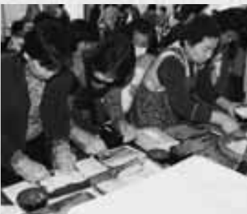
昨年の体験コーナーの様子

場所 市民文化会館小ホール 内容 フリーマーケット、体験コーナー(芋もち作り、6つの栄養素のり巻き等)、下田小学校5年生「総合学習発表内容」展示、着ぐるみ寸劇、食品品質基準表示パネル展示、電気教室、電気安全相談コーナー、防犯ビデオ・防犯グッズの展示、防犯クイズ、消費生活相談、牛乳パック40枚とトイレトペーパーの交換など その他 託児室を用意してあります。ご利用ください。