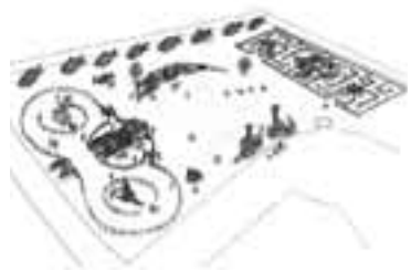
今回の会場イメージ図

第3回「風の花祭り」がまどが浜海遊公園にて開催されます。今回のテーマは「どうぶつこうえん」。公園内の芝生に市内の保育所・幼稚園・小学校・中学校の児童生徒と市民が作った、梅・桜・チューリップ・菜の花・たんぽぽなど20種類以上、約8,000個の花の風ぐるまが、カバヤウサギ、キリンなどの可愛い動物のモニュメントに彩られ、海風に吹かれ元気いっぱいにまわります。