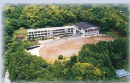
平成 9 年