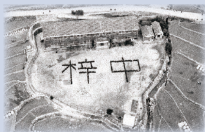
昭和 35 年

最後になりますが、七十五年間の長きに渡り本校を支え、そして温かく見守っていただいた皆様、これまで本当にありがとうございました。これからも何十年、何百年と、この稲梓の地で育つ子供たちの明けゆく未来に幸多きことを祈念しております。