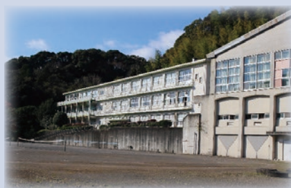
令和 3 年度 (閉校)