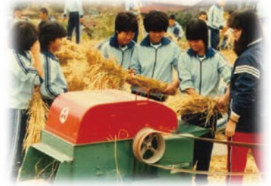
稲作活動開始当初(昭和57年ごろ)