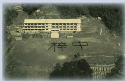
昭和 37 年 (新校舎完成)