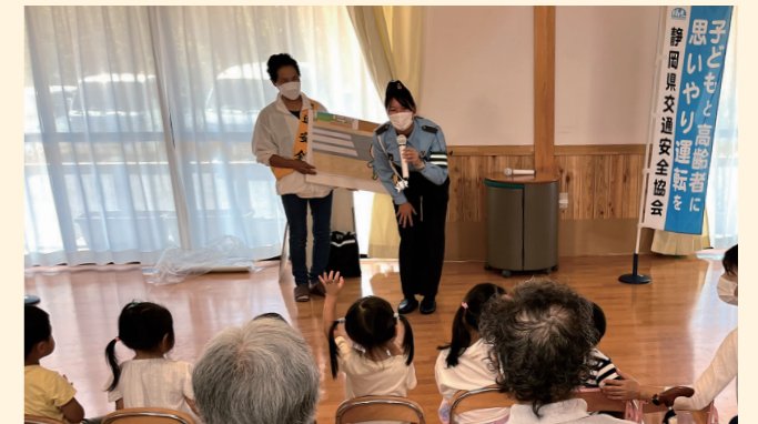
9/13 交通安全教室 みくらの里にて高齢者と子どもを対象に、静岡県交通安全協会下田地区支部が主催する交通安全教室が行われました。静岡県警察音楽隊による演奏や、パトカー・白バイの展示などもあり、楽しく交通安全を学びました。