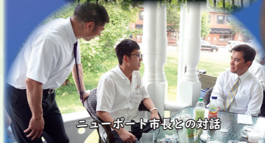
ニューポート市長との対話