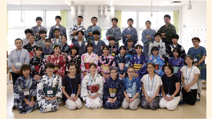
9/6、7、20 浴衣の着付け体験 下田中学校3年生を対象に浴衣の着付け体験が行われました。今年度開設されたコミュニティ・スクール(学校運営協議会)を通して紹介された下田市着物愛好会の方々を講師として、実際に浴衣の着付けを行うことで日本の伝統文化を体験、学習していました。