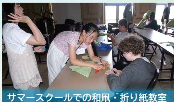
サマースクールでの和風・折り紙教室