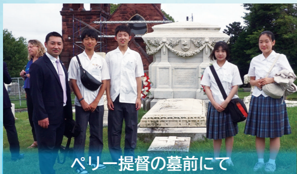
ペリー提督の墓前にて