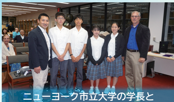
ニューヨーク市立大学の学長と