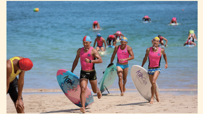
9/2～3 ライフセービング大会 外浦海岸で、ライフセービングの全日本ジュニア/ユース/マスターズ選手権大会が開催されました。全国から26チーム505人が出場し、8歳以上から50歳以下の幅広い世代が集まり日頃の練習の成果を發揮しました。