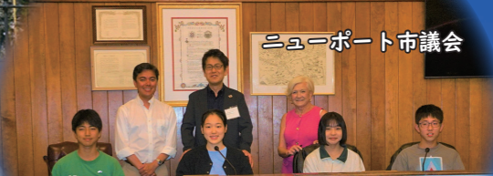
ニューポート市議会