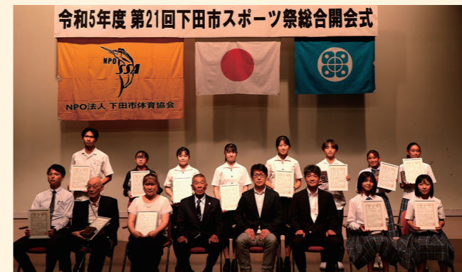
9/8 下田市スポーツ祭総合開会式 スポーツ祭総合開会式が市民文化会館にて開催されました。今年度は体育協会加盟12団体による大会が市内各所で行われます。また、本開会式に合わせ、体育協会が功労者や優秀選手等を表彰し、その功績を称えました。