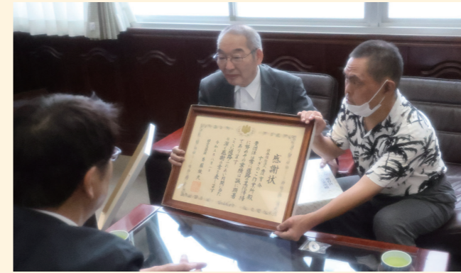
8/28 道路をきれいにしてくれてありがとう 社会福祉法人覆育会すぎのこ作業所が、「道路ふれあい月間」における道路愛護団体等の国土交通大臣表彰を受けました。長年にわたり、ごみ拾い、駐車場清掃、草刈りを行い、積極的に道路美化に貢献したことが受賞へとつながりました。