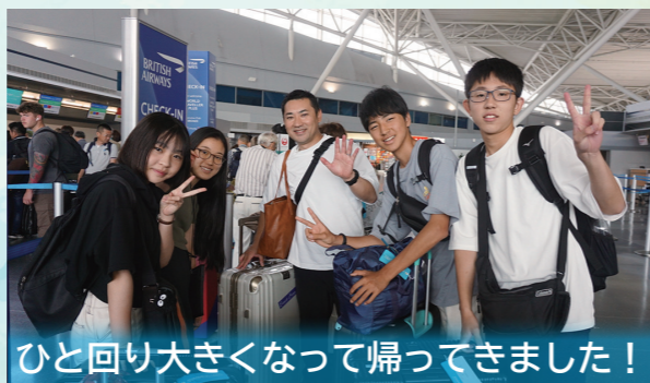
ひと回り大きくなって帰ってきました!