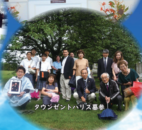
タウンゼントハリス墓参