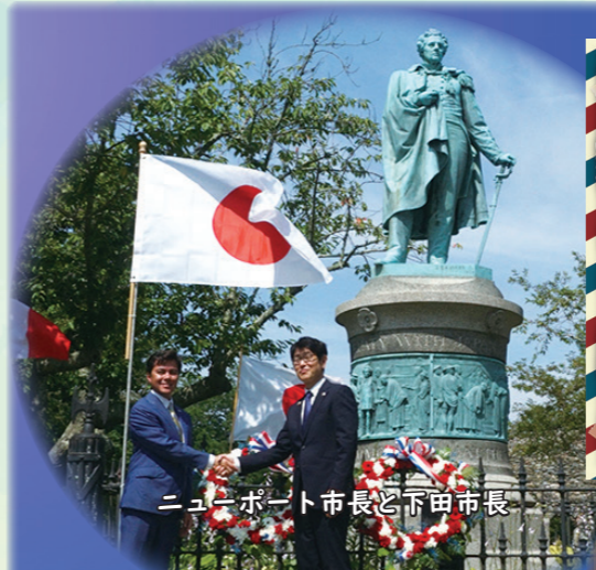
ニューポート市長と下田市長