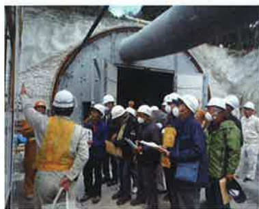
現場見学会の様子

伊豆縦貫自動車道・河津下田道路において、河津町逆川と同町小鍋を結ぶ「河津トンネル（仮称）」の工事現場見学会を11月14日に開催し、市民12名が参加しました。 参加者は蓮台寺IC（仮称）、下田北IC（仮称）付近において、計画されるインターチェンジの概要を聞いた後、トンネル工事現場では、国職員の説明を受けながら、実際の工事の様子を見学しました。