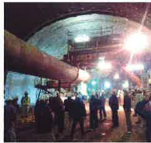
湯ヶ島第二トンネル坑内