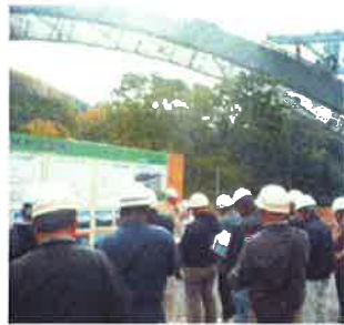
狩野川横断高架橋