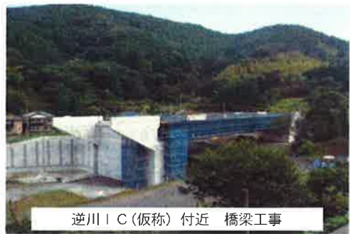
逆川IC(仮称)付近 橋梁工事

現在、河津下田道路Ⅱ期区間(箕作～河津町梨本)の河津IC(仮称)と逆川IC(仮称)付近で橋梁工事、盛土工事、工用道路の建設などが進められています。引き続き本ヶ所の工事を進めていくと同時に、下田市内の用地取得を進めていきますので、ご協力よろしくお願ひします。