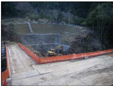
町道橋工事(仮称：小渡戸橋)

河津町河津 IC 地区では大鍋川にかかる町道橋の工事を行っています。引き続き整備する町道とともに工事用道路として利用させていただきますが、将来は地元の方の生活道路となります。