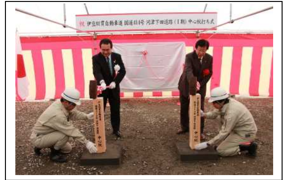
期と 期の境界に中心杭が打たれました。

伊豆縦貫自動車道に関するご意見・ご質問等がありましたら、こちらにお寄せください。