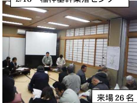
2/18 稲梓基幹集落センター