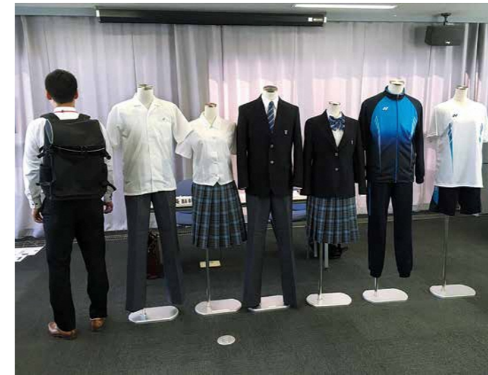
選定された新中学校の制服・ジャージ(体操服)・カバン

新中学校の部活動について ①現状の部活動設置状況 (平成31年4月現在) 既存4中学校の部活動は、4月1日現在で上表のとおりとなっています。 ②現時点における市の方針 市として、既存4中学校で設置している部活動を最優先とするため、次の方針を示しています。 ○学校再編前の新たな部活動の合同チーム設置は行わない。 ○学校再編後に新たな部活動の拡充。既存部活動が不足となった場合、合同チーム設置を検討。 ③部活動検討スケジュール 統合推進部会(校長会)及び生徒指導部会において、部活動現状把握やガイドライン等調査研究とともにアンケートの実施等を行う予定です。 ※新中学校の部活動については、方向性を今年度末までに公表できるよう協議・調整を進めます。 ※進捗状況は随時、学校統合準備委員会で報告するとともに「広報しもだ」などでもお知らせします。