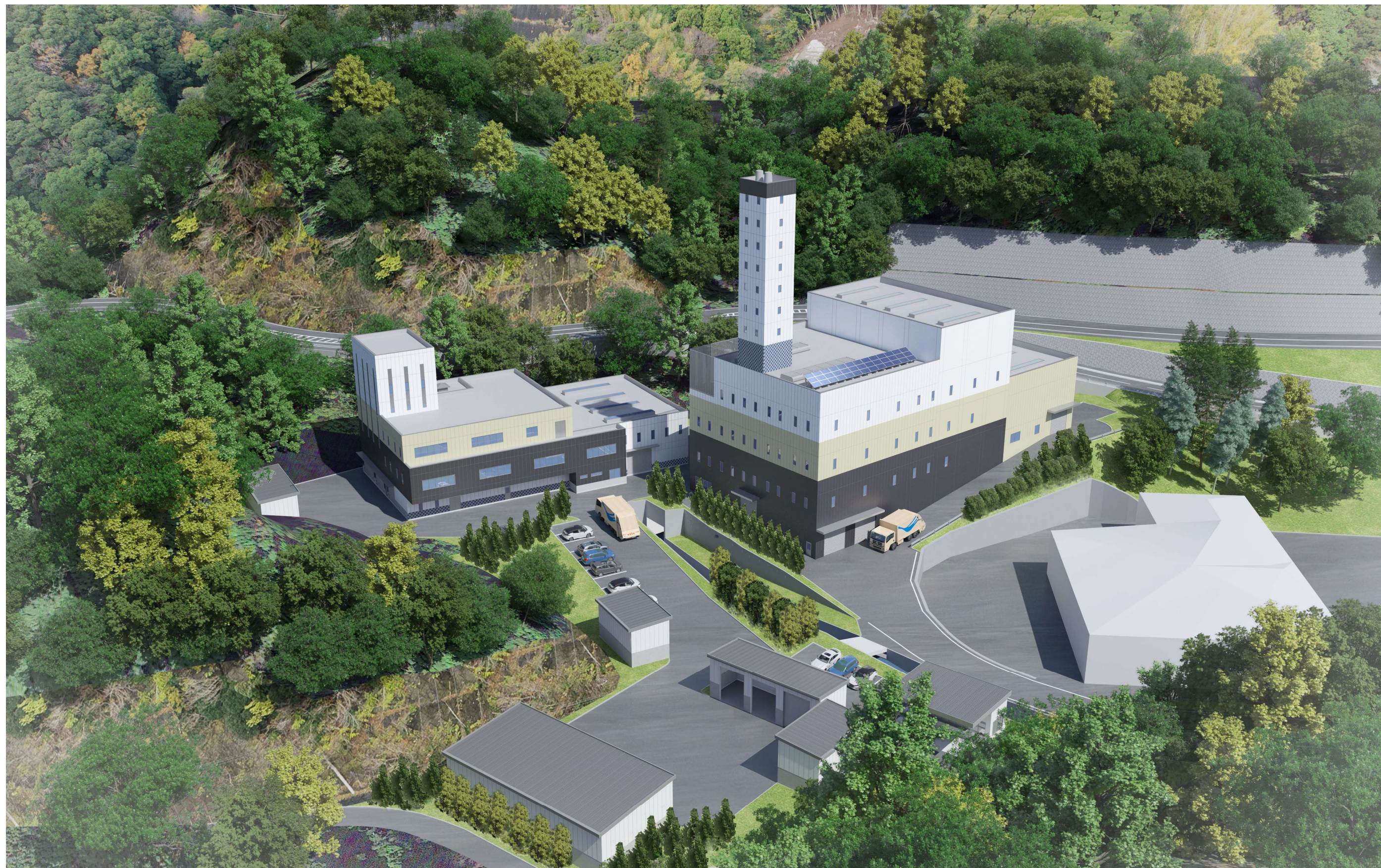
图 12-3 鸟瞰图