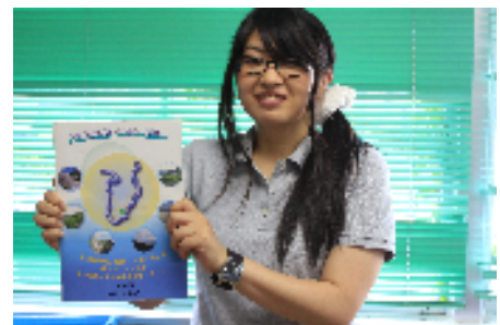
↑平成 18 年に策定した都市マス

都市計画マスタープラン(都市マス)とは、 「将来どんなまちを目指すのか」 「どんなことに力を入れていくのか」 といった「まちの設計図」を定めるものです。