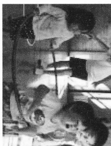
体育館で遊ぼう 体を動かして遊ぶと気持ちがいいですよ！