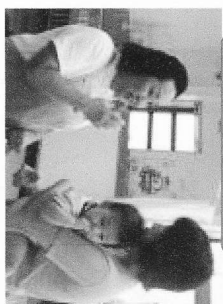
親子歯磨き教室 仕上げ磨きのコツは？... 乳歯のケアも大切にね！