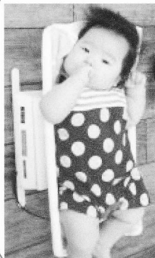
発育測定・発育相談 どれくらい大きくなったかな...