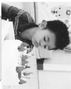
誕生会 大勢のお友達が集まって 思い出に残る1日です。