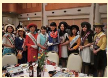
昨年のフラワーパーティーの一幕

各都市市民交流団と交流する、フラワーパーティーの参加者を募集しています。参加を希望される方は左記までお申し込みください。