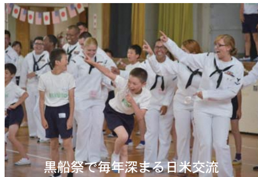
黒船祭で毎年深まる日米交流

また、サーフィンについては、透明度抜群の絶好のサーフポイントが数多くあり、トッププロサーファーを数多く輩出しています。毎年、全国大会規模のコンテストが開催されるとともに、多くのサーファーが訪れるサーフィンのメッカとして知られています。