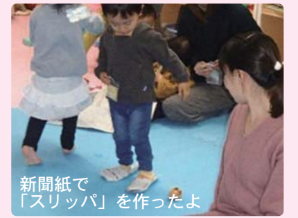
新聞紙で「スリッパ」を作ったよ