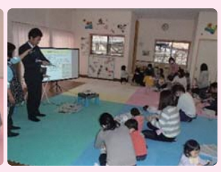
防災「サバイバルスキルアップ講座」

春の訪れを感じ、暖かくて柔らかな日差しが差し込むようになりました。春は、新しいスタートの季節ですね。幼稚園・保育所への入園を心待ちにしているお子さんもお子さんもいることでしょう。 また、すくすく大きくなっているお子さんの成長を改めて感じさせてくれる季節でもあります。 今月は「大きくなったねの会」で一年間を振り返り、みんなで成長を喜びあいましょう。