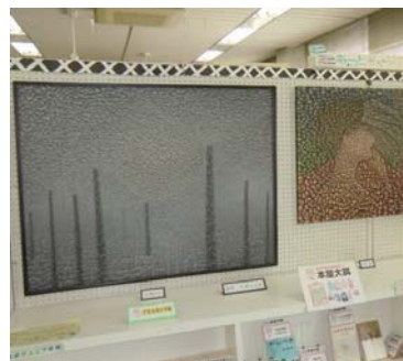
5月のアートギャラリーの様子 平成29年5月『油彩画』

白石仁章講演会「プチャーチン」と「杉原千畝」記念企画 ~プチャーチン・杉原千畝ゆかりの地写真展~