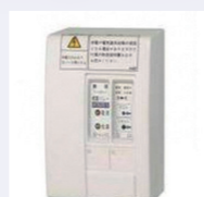
▲既存のブレーカーに外付けできるタイプ