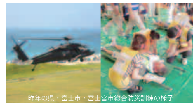
昨年の県・富士市・富士宮市総合防災訓練の様子

賀茂地域で初めてとなる静岡県との合同総合防災訓練です。第4次地震被害想定を基に、自助・共助・公助を取り入れた実践的訓練を行います。市内でも市街地、臨海部、山間部それぞれの地区で状況にあった訓練が各種予定されています。訓練当日は、訓練会場となる海浜、敷根公園、市役所周辺など、近くにお住まいの方、利用者の皆様方にご迷惑をおかけしますが、ご理解とご協力をお願いします。