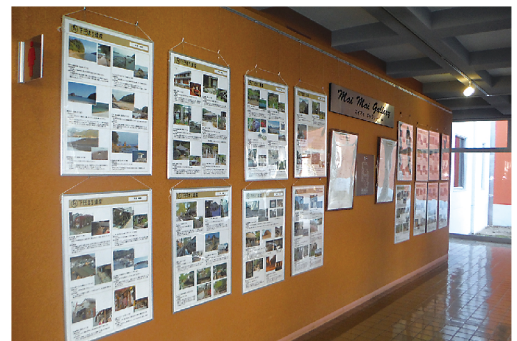
マイマイギャラリーにて下田まち遺産を紹介するパネルを展示しました

平成29年12月1日(金)から20日(水)までの20日間、下田市民文化館1階のマイマイギャラリーにおいて、まち遺産の価値や下田の美しい景観を感じていただくため、「下田まち遺産ギャラリー」を開催しました。これまでに認定された下田まち遺産の中から、地域別にその一部の写真を展示し、来館者の皆さまにご覧いただきました。