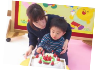
お母さんと一緒にフーってしたよ