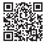
県ホームページ QRコード