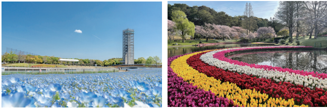
浜名湖ガーデンパーク会場 浜松市中央区村櫛町 5475-1 はままつフラワーパーク会場 浜松市中央区館山寺町 195

2004年に開催された「浜名湖花博」の20周年を記念して、今年の春に浜名湖ガーデンパークとはままつフラワーパークの2つの会場で、「浜名湖花博2024」を開催します。チューリップやネモフィラ、バラ、マーガレットなど多種多様な満開の花々が会場を彩り、プロのガーデンデザイナーが監修した庭園に加え、先端技術を駆使したデジタルアトラクション、静岡県食材のグルメなど特別な魅力が満載です。いつもと違う感動がいっぱいの浜名湖花博2024に、是非お越しください。