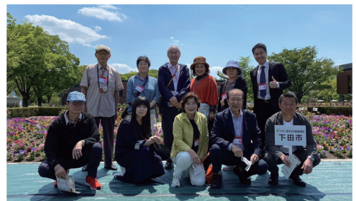
前回の様子（福岡県久留米市）