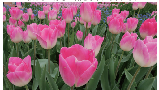
富山県砺波市のチューリップ