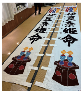
大賀茂区の整備例

の収益を財源として、自治会の設備や備品の整備に対して助成する事業です。大賀茂区では、一般コミュニティ助成事業を受けて、祭典用備品の整備を行いました。歴史ある地域の伝統行事を引継いでいくための体制が整い、地域コミュニティの活性化につながっております。