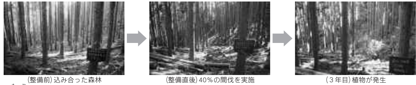
(整備前) 込み合った森林