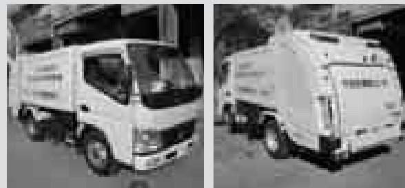
(7号車：写真左) 平成20年度地域活性化、生活対策臨時交付金事業 (8号車：写真右) 平成21年度地域活性化、経済危機対策臨時交付金事業