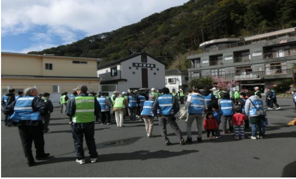
訓練内容の説明の様子

平成27年3月8日、市内各地において津波避難訓練を実施し、5,000人を超える市民の皆様に参加いただきました。西本郷区では、マックスバリュ伊豆下田店にご協力いただき、買い物途中の被災を想定した訓練を行いました。蓮台寺区では、避難場所の稲生沢小学校に訓練参集の後、地震ザブトンの体験会を行いました。