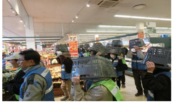
買い物かごで頭部を保護しながら避難しているところ