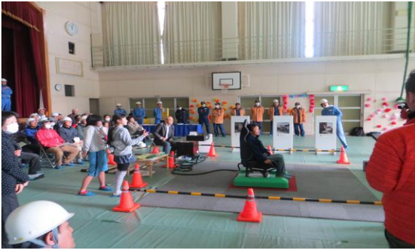
地震ザブトン体験中